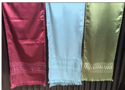
Seidenschal, 35×150 cm

Stickereien: Kunstvoll von Hand bestickt mit geometrischen, traditionellen afghanischen Mustern. Für Seidenschals, Blusen und Seidentäschli ist ein breites Farbenspektrum verfügbar. Bitte bevorzugte Farben angeben.