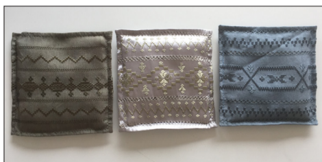
Lavendelsäckli, 14×14 cm