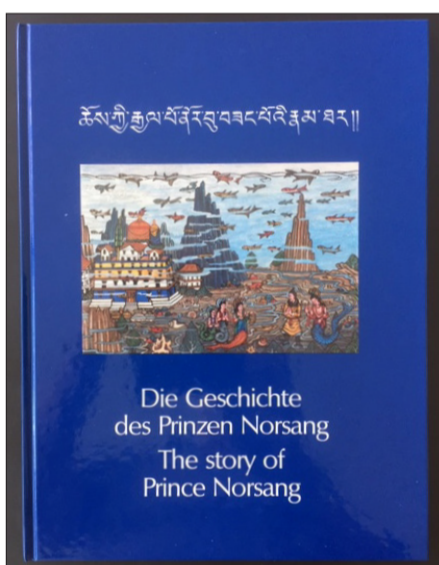
Buch «Prinz Norsang» Volkslegende aus Tibet

Anzahl / Farbe _____ beige _____ blaugrau _____ taupe _____ grüngrau _____ dunkelbraun